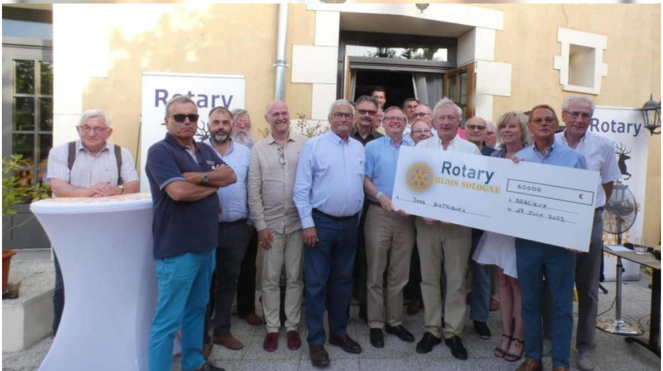
Remise de dons juin 2022

Cela n'aurait pas été possible sans nos partenaires.